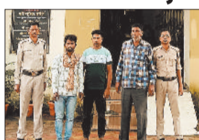
पुलिस गिरफ्तार में आरोपी।