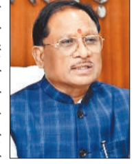
9.49 करोड़ की लागत से होगा मरम्मत व जीर्णोद्धार कार्य

जिर्णोद्धार कार्य, 3 करोड़ 46 लाख 14 हजार रुपए की लागत के विकासखंड बगीचा में सोरो व्यपवर्तन योजना का मरम्मत एवं जीर्णोद्धार कार्य और 2 करोड़ 55 लाख 88 हजार रुपए की लागत से विकासखंड फरसाबहार की अंकिरा तालाब योजना का मरम्मत एवं जीर्णोद्धार कार्य शामिल है। इन कार्यों के पूर्ण हो जाने पर सिंचाई की सुविधा में बढ़ोतरी होगी। किसानों को वर्षभर फसलों के लिए पर्याप्त पानी उपलब्ध होगा। इसके साथ ही जल संरक्षण को बढ़ावा मिलेगा जिससे सूखे की स्थिति में भी फसलों को सुरक्षित रखा जा सकेगा। इन कार्यों के पूरा हो जाने से न केवल किसानों की आय और उत्पादन क्षमता में वृद्धि होगी, बल्कि ग्रामीण अंचल की कृषि आधारित आर्थिक गतिविधियों को भी नई गति प्राप्त होगी।