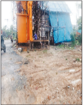
■ कहीं सालों से मुफ्त सुविधा तो कहीं एक बार का भारी शुल्क

शहर की कई गणेश पूजा समितियों का कहना है कि कुछ स्थानों पर आयोजन समितियों को साल भर मुफ्त में मैदान उपलब्ध कराया जाता है, जबकि कई समितियों से एक बार के आयोजन के लिए भी भारी शुल्क वसूला जा रहा है। वहीं, कुछ समितियों सालों से कब्जाई जगह पर आयोजन करती आ रही हैं और वहां से लाखों की उगाही भी हो रही है, मगर