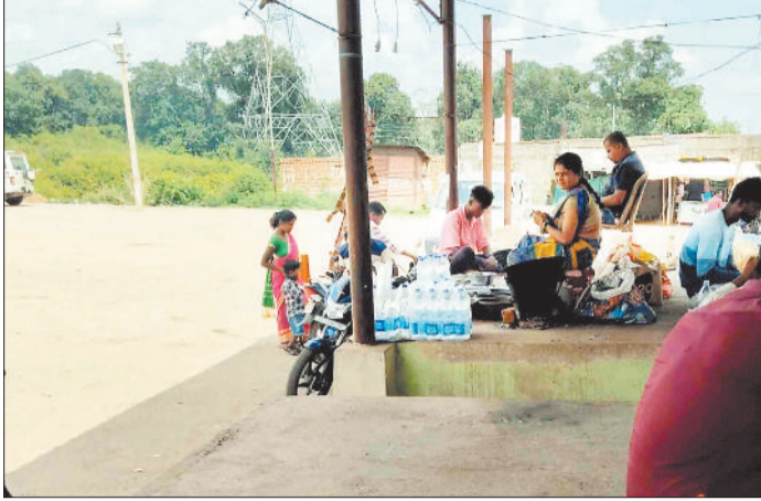
शेड के नीचे शराब खोरी करते नशेड़ी।