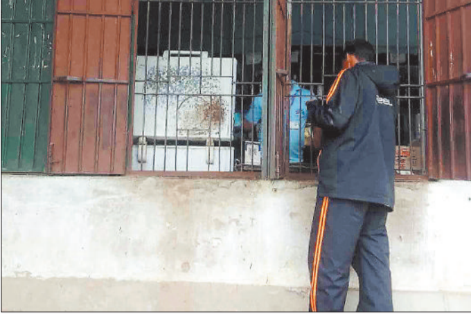
शराब खरीदते युवक।