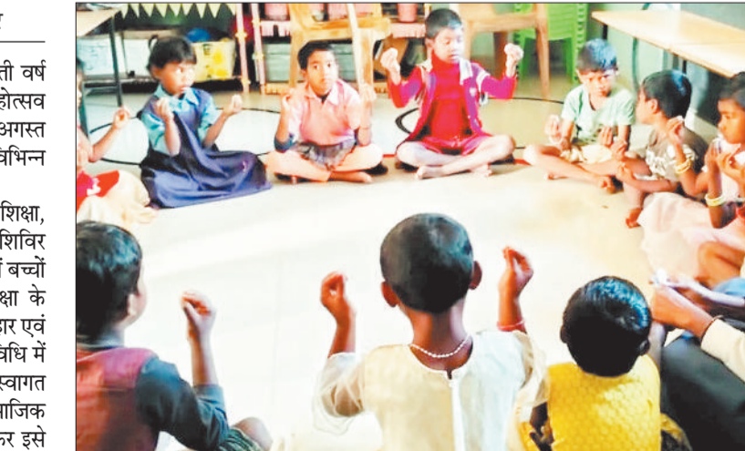
खेलते हुए बच्चे।

छत्तीसगढ़ राज्य निर्माण के रजत जयंती वर्ष होने के उपलक्ष्य में जिले में रजत महोत्सव मनाया जा रहा है। इसी तारतम्य में 24 अगस्त को जिले के सभी आंगनबाड़ी केंद्रों में विभिन्न कार्यक्रमों का आयोजन किया गया। जिसमें शाला पूर्व अनौपचारिक शिक्षा, प्रधानमंत्री मातृ वंदना पंजीयन शिविर आयोजित कर सभी आंगनबाड़ी केंद्रों में बच्चों के द्वारा शाला पूर्व अनौपचारिक शिक्षा के अंतर्गत विभिन्न गतिविधि का एक त्योहार एवं उत्सव की तरह मनाया गया। इस गतिविधि में बच्चों ने खेल-खेल में एक दूसरे का स्वागत किया एवं कई प्रकार के शारीरिक, सामाजिक एवं बौद्धिक गतिविधि का आयोजन कर इसे एक त्योहार के रूप में मनाया। जिसमें बच्चों को बहुत सारी आवश्यक कलाएं खेल खेल में